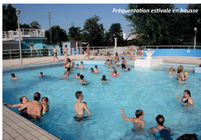
Fréquentation estivale en hausse