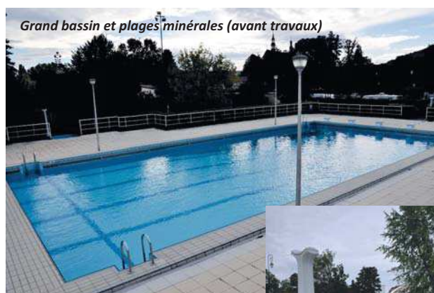
Grand bassin et plages minérales (avant travaux)

Le coût des travaux est estimé à 1 250 000 € HT.