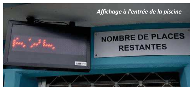
Affichage à l'entrée de la piscine

La FMI a été atteinte à cinq reprises durant l'été, nécessitant le blocage des entrées durant un quart d'heure environ.