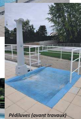
Pédiluves (avant travaux)